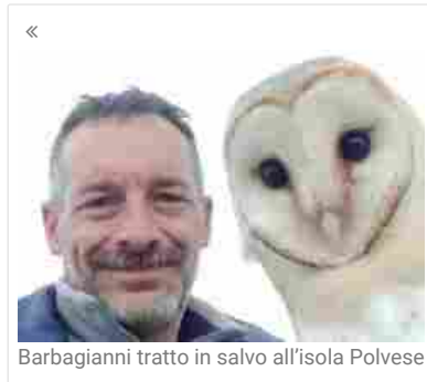
Barbagianni tratto in salvo all'isola Polvese